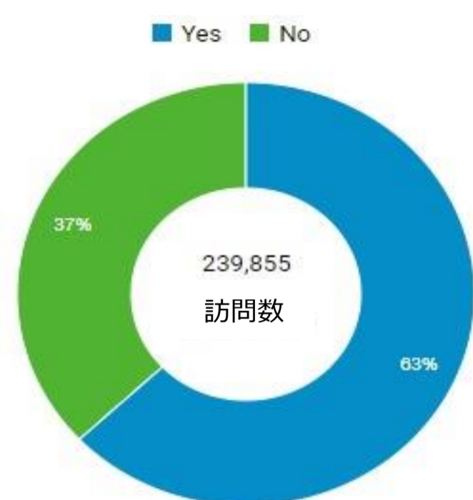
モバイル（タブレット含む）の比率